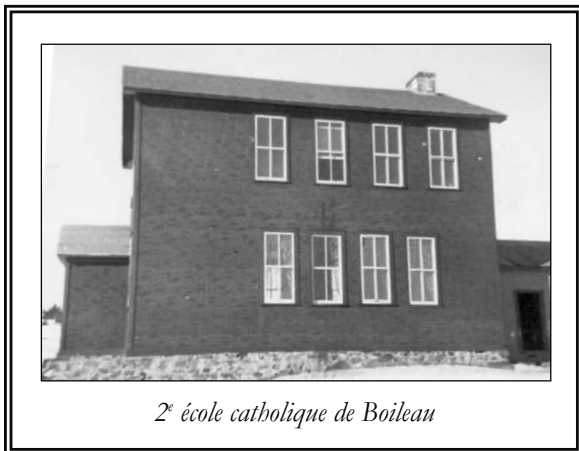
2 e école catholique de Boileau

Vers les années 1940, afin d'offrir aux élèves les cours de 8 e et de 9 e année, un second étage avait été ajouté et un deuxième professeur a été engagé. De plus, elle servait de salle pour les assemblées du conseil de ville. Elle passa au feu vers 1953.