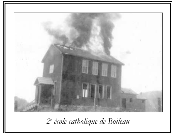
2 e école catholique de Boileau