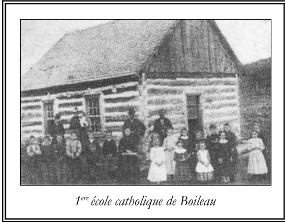
1 re école catholique de Boileau