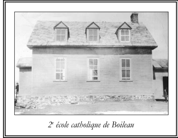
2 e école catholique de Boileau

La première école du hameau de Boileau était située en face de l'église actuelle. Vers 1915, faute d'espace pour y loger l'institutrice et y recevoir tous les enfants, elle fut abandonnée et remplacée par une autre plus spacieuse.